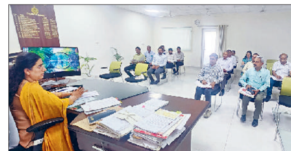
चरखी दादरी। फसल खरीद की तैयारियों की समीक्षा करती उपायुक्त।